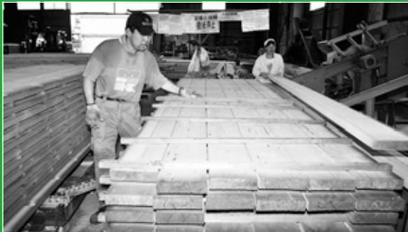
三津橋興産株式会社