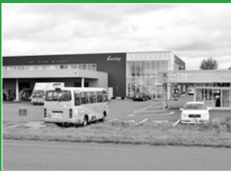
36人の障害者が働くクリーニング工場