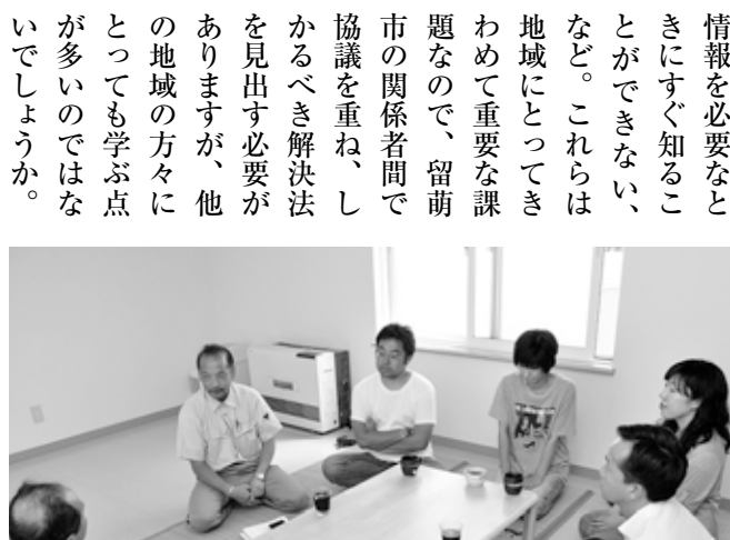
留萌市でのミーティング

護学校高等部の地域への働きかけや進路指導教員の支援の様子が居住地の小・中学校（養護学校小・中学部）の保護者にはほとんど情報が入らない、④事業主の立場からは、留萌市には障害者を雇用している企業があっても、職親会のような活動がないために、その経験や雇用のノウハウについての情報を必要とすることができない、など。これらは地域にとってきわめて重要な課題なので、留萌市の関係者間で協議を重ね、しめるべき解決法を見出す必要がありますが、他の地域の方々にとっては学ぶ点が多いのではないのでしょうか。