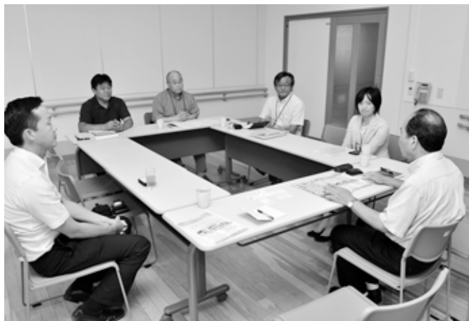
旭川市職親会を訪ねる