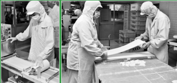
障害者10人が働いている