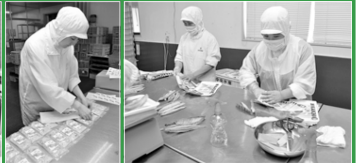
魚の干物の包装作業をする障害者たち